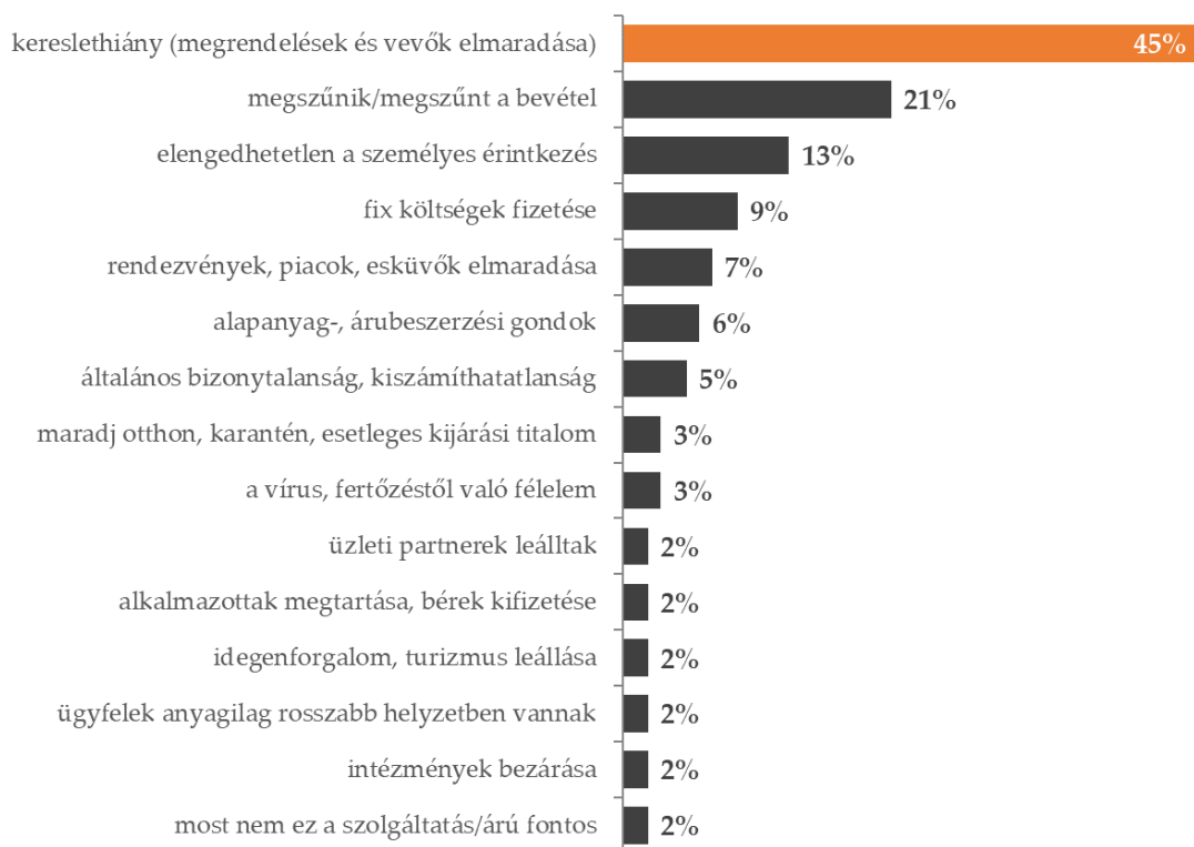
2. ábra: Jelenleg mi okozza az Ön cége működés szempontjából a legnagyobb problémát? (n=4382)

mert önként bezártak a kereslethiány miatt vagy biztonsági okokból. Biztonsági okokból elsősorban azok a vállalkozások zártak be, akik fő problémának a személyes érintkezés elengedhetetlenségét jelezték. Kozmetikusok, fodrászok, tetoválók, masszőrök, kutyakozmetikusok, optikusok, fotósok, tolmácsok, ingatlan közvetítők számoltak be arról, hogy mivel a munkájukhoz mindenképp személyes érintkezésre van szükség inkább felfüggesztették a tevékenységüket. A válaszadók 9 százaléka írta azt, hogy a legnagyobb problémát a fix költségek kifizetése jelenti számukra. Fix költségként az adókat, bérleti díjakat, közüzemi díjakat, béreket és járulékokat említették, amelyeket a csökkent vagy megszűnt bevételek mellett nehezen tudnak kifizetni. A válaszadók 7 százaléka említette, hogy a rendezvények, piacok, esküvők elmaradása okozza számukra a legnagyobb problémát, 6 százalékuk számolt be arról, hogy alapanyag és árubeszerzési gondokkal küzdenek. A nyitott kérdésre válaszoló 5 százaléka említette fő problémaként az általános bizonytalanságot, kiszámíthatatlanságot.