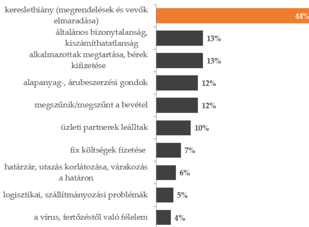
6. ábra: Jelenleg mi okozza az Ön cége működés szempontjából a legnagyobb problémát? (közepes vállalkozás és nagyvállalat, 50 fő felett, n=145)