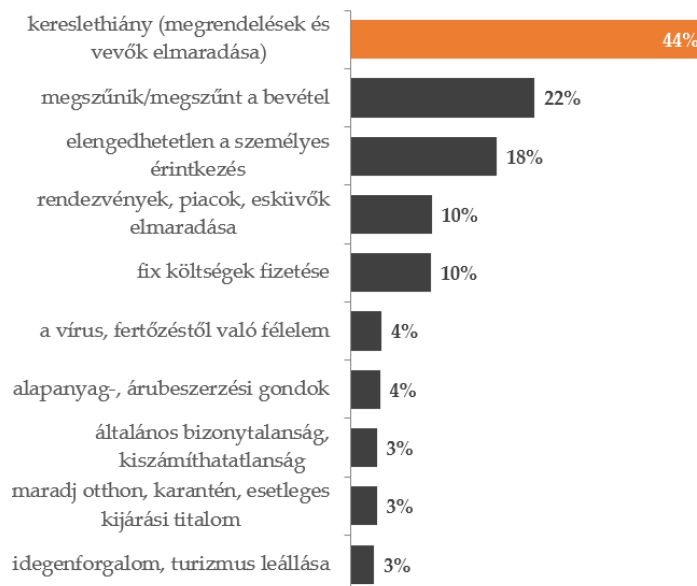
3. ábra: Jelenleg mi okozza az Ön cége működés szempontjából a legnagyobb problémát? (egyéni vállalkozó, n=1894)

Mind a négy vállalkozás típus 10 legfőbb említett problémája között szerepel a fix költségek fizetése. Az egyéni vállalkozók 10 százalékának ez okozza a legnagyobb problémát, mikrovállalkozások esetén 9, kisvállalkozások körében 7, míg a közepes és nagyvállalatok esetén 7 százalék említette a fix költségek fizetését a legfőbb problémák között.