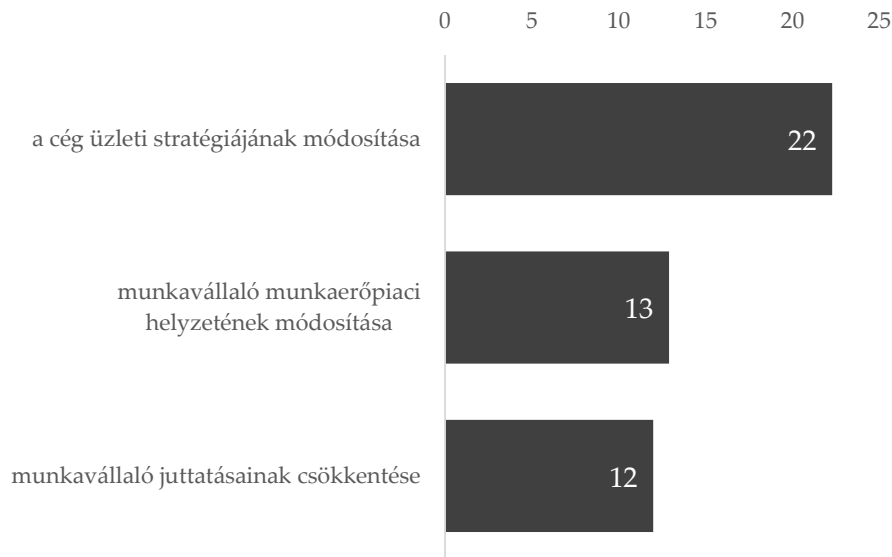
2. ábra: Azon vállalkozások aránya, amelyeknél a minimálbér, illetve a garantált bérminimum emelése nyomán sor került / sor fog kerülni a felsorolt lépésekre 2017-ben, százalék